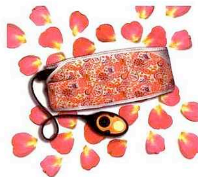
Ceinture Goa Slendertone 179,99 €. En exclusivité sur www.laredoute.fr

... incognito. Avec cette ceinture lookée qui vous permettra de vous dessiner de jolis abdos sans souffrir.